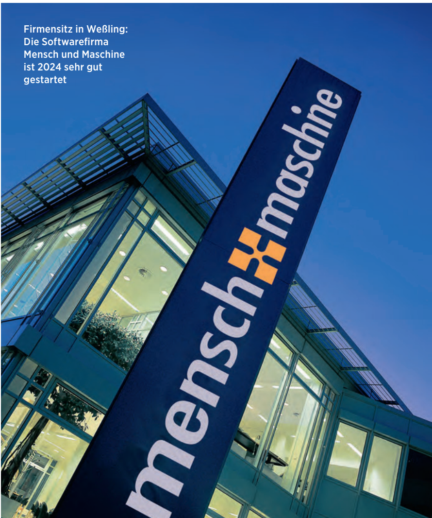
Chart: BO Data, small charts; Bild: Mensch und Maschine, Deutschland GmbH

Firmensitz in Weßling: Die Softwarefirma Mensch und Maschine ist 2024 sehr gut gestartet